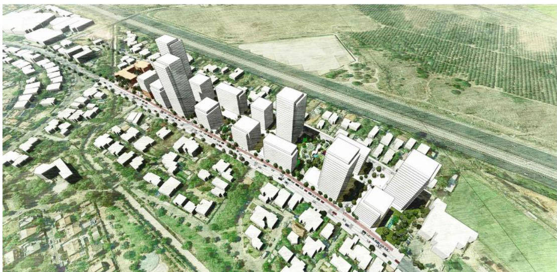
1 הדמיה. מתחם יצחק שדה, מבט מדרום

ניתן לעיין במסמכי התכנית באתר הוועדה המקומית אזור, לסריקה: