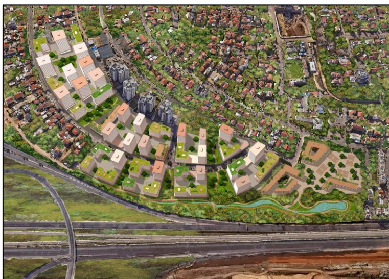
1 הדמיה. מתחם בן גוריון-בן צבי, מבט מכיוון כביש 1 - אילוסטרציה בלבד

כידוע, בימים אלה מקדמת המועצה המקומית אזור יחד עם הרשות הממשלתית להתחדשות עירונית תכנית מפורטת (תב"ע) להתחדשות במתחם בן גוריון - בן צבי.